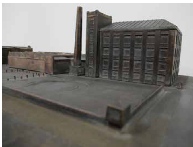
Makieta więzienia na Radogoszczu.

Jednocześnie trwają zintensyfikowane prace nad zadaniem pn. „Zabrał ich ogień... Piekło więzienia na Radogoszczu w świetle losów ludności Kraju Warty w okresie II wojny światowej”. Obecnie prowadzone są rozmowy z MPK-Łódź Sp. z o.o. w sprawie wykonania repliki tramwaju Lilpop III, który ma stanąć w centralnej części nowej wystawy.